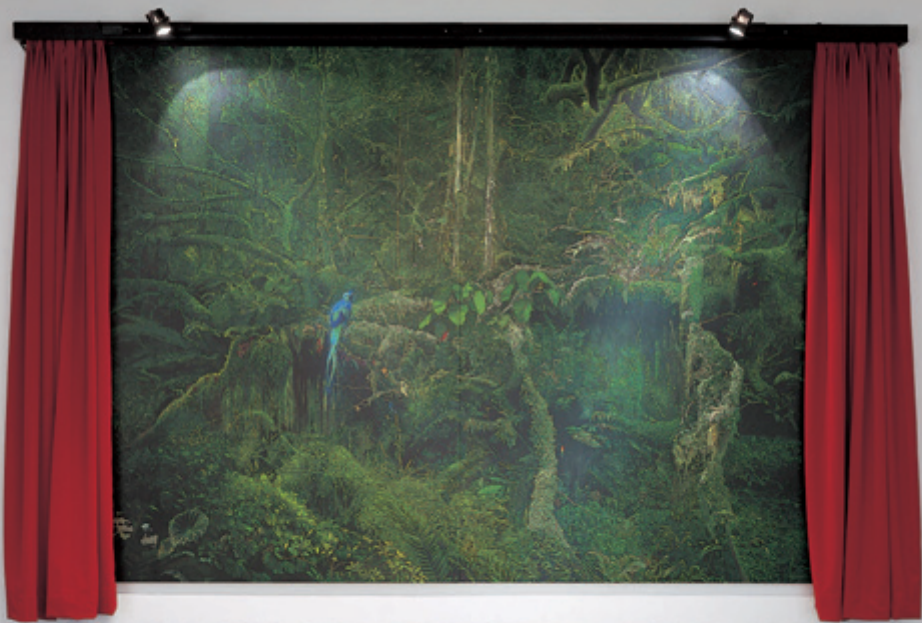
世界のカタチ(OUTSIDE INSIDE)Ⅱ 2005 キャンバスにアクリル絵具、 メディウム、布、木、照明器具 218×324cm