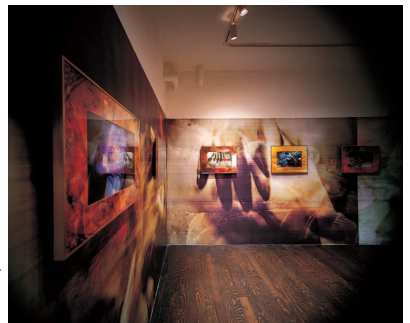
波打ち際に触れて 1996 デジタル・コピー、 フレーム 制作協力=富士ゼ ロックス

「予備校についで、菊などを写生させる大学の授業が退屈で、友人と銀座のギャラリー巡りをはじめ、現代美術の作品を知るように