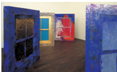
無題 1985 木に石膏、 アクリル絵具

1988年、東京・銀座、コバヤシ画廊の個展会場で。サンプリングした画像を引き伸ばしたプリントの上にアクリルやメディウムで描く作品を多く制作した。背景の作品は、『Video Age Fantasia』(次ページ上)。この作品には、アンドレイ・タルコフスキーの『ノスタルジア』の一部が使われている