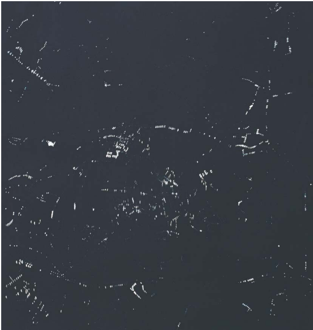
HOME-OK-07-03 2007 綿布にアクリル絵具、グワッシュ 72×70cm [*]