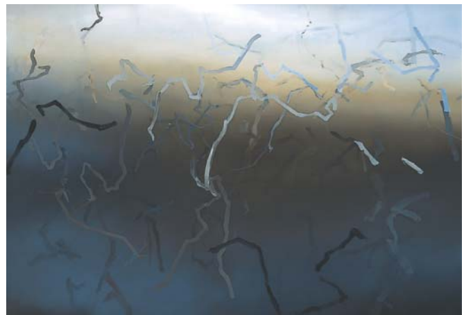
光の匂ひーみこもりVI 2004 キャンバスに油彩 162.2×227.2cm

「写真の断片を写して描くことで、キャンバスとの間に距離を保てるようになりました」