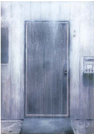
ドア 1990 紙に鉛筆、顔料 78.8×109cm

1992年、沖縄・玉城村百名のビーチにて。150号の額縁のみを並べて、《銚子の海》と名づけた。別な場所の名前を付けてみたのは、フレームによって切り取られる海の匿名性に絵画の虚構性を重ねて示したかったから